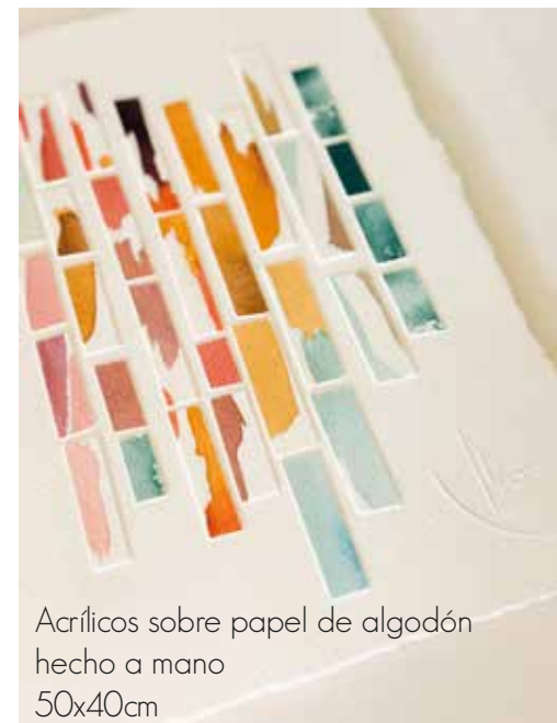
Acrílicos sobre papel de algodón hecho a mano 50x40cm