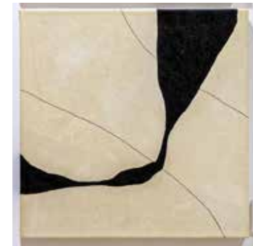
Técnicas mixtas sobre lienzo 50x50cm